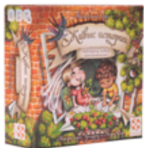
Живые истории. Дополнение