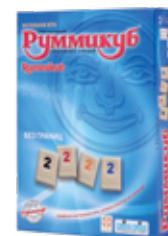
Руммикуб без границ (мини)